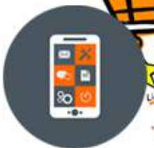
Desarrollo de Aplicaciones Móviles