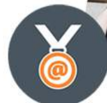
Guayoyo Marketing Academy