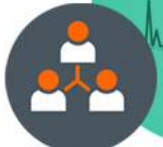
Gerencia de Redes Sociales