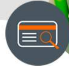
Posicionamiento SEO y SEM